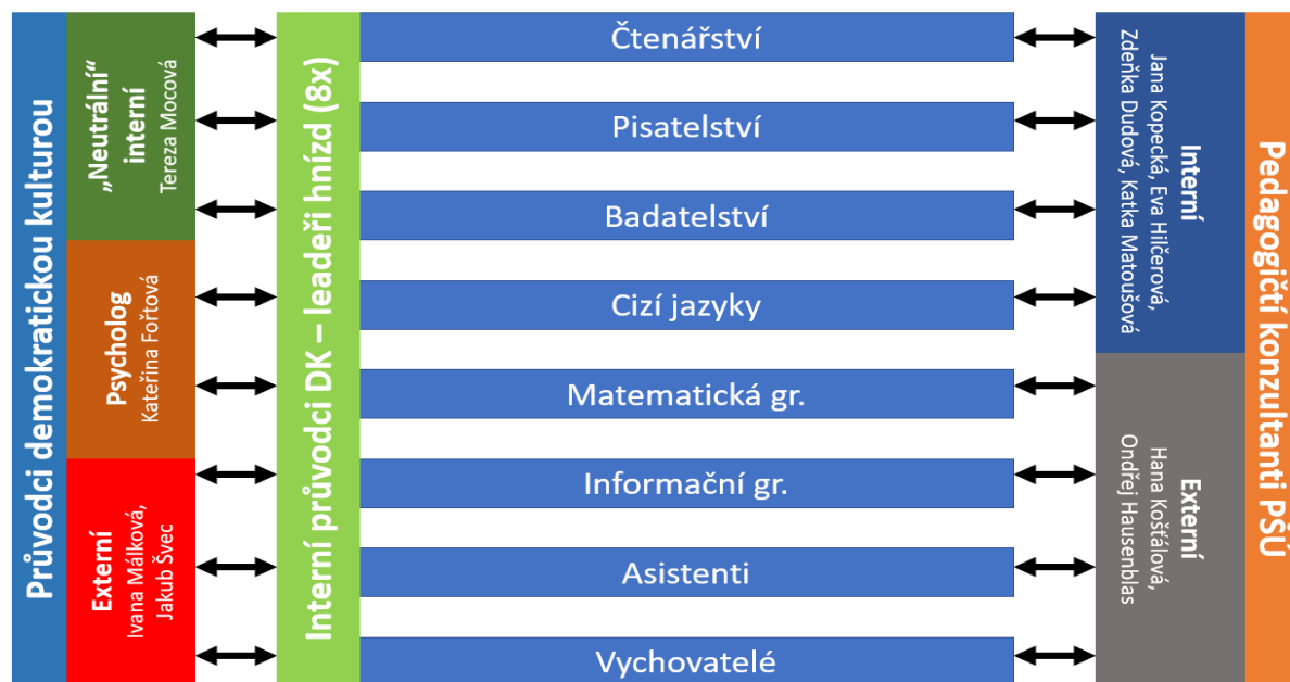
Obr. 2: Organizační schéma kolegiální podpory v rámci projektů DK a PŠÚ

Logiku projektu a jeho propojení s projektem Pomáháme školám k úspěchu naznačují připojená schémata: