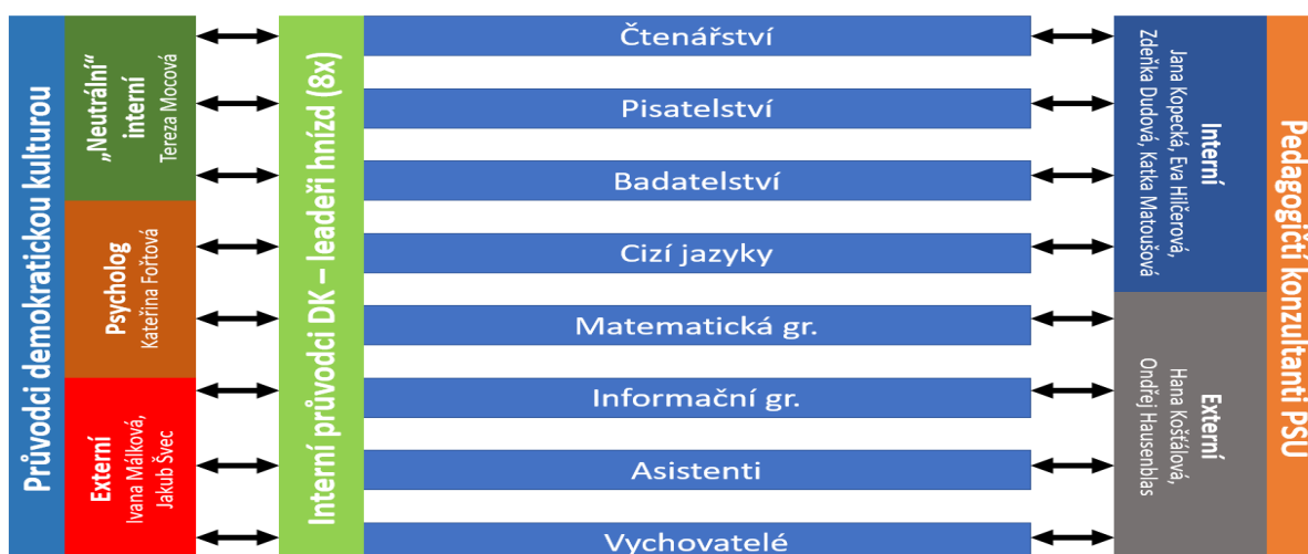
Obr. 2: Organizační schéma kolegiální podpory v rámci projektů DK a PŠÚ